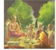
କହିଯାମନବ ବିନ ବିନ ଭାବ ଓ ବିନ ବିନ ପ୍ରକାର ଉତ୍ତମି ବେଷ୍ଟ ଜ୍ଞାନା ଗୋବ ଦେବାନବର ପୂଜାବ ବାଣିପାରିକ ଓ ଅନୁଷ୍ଠାନ ବର୍ତ୍ତମାନ