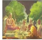
ଭବିଷ୍ୟତପର ମନ ଶ୍ରେଷ୍ଠ ଅଟେ । ମନରୁ ଦୂର ଶ୍ରେଷ୍ଠ ଅଟେ । ଦୂରରୁ ମହାନ ଆତ୍ମା ଶ୍ରେଷ୍ଠ ଅଟେ । ଅନ୍ତରୁ ଅନ୍ତର (ବ୍ରହ୍ମ) ଶ୍ରେଷ୍ଠ ଅଟେ ।